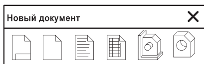
Рис. 1.4. Развернутая панель команды Создать

В главном меню имеется меню Выделить . В нем находятся команды, предназначенные для выделения различными способами тех или иных элементов чертежа ( Рамкой , Секущей рамкой и т. д.). Для того чтобы выделить весь чертеж, необходимо воспользоваться командой Выделить все , которая находится в меню Редактор (в соответствии стандартам Windows). Однотипные команды расположены в разных меню, что, на наш взгляд, создает значительные неудобства в работе пользователя.