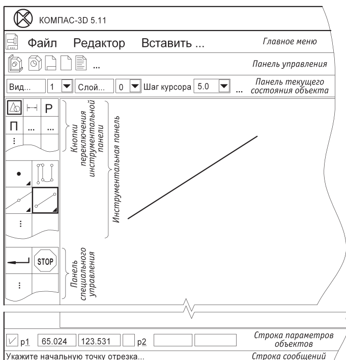
Рис. 1.1. Рабочий экран Компас-3D 5.11

стно с панелью Свойств . Панель Управление разделена на две панели: Стандартная панель и панель Вид . Методика работы с документами осталась прежней.