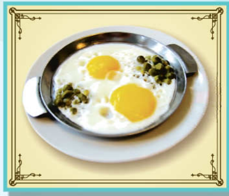
Яичница-глазунья с гарниром