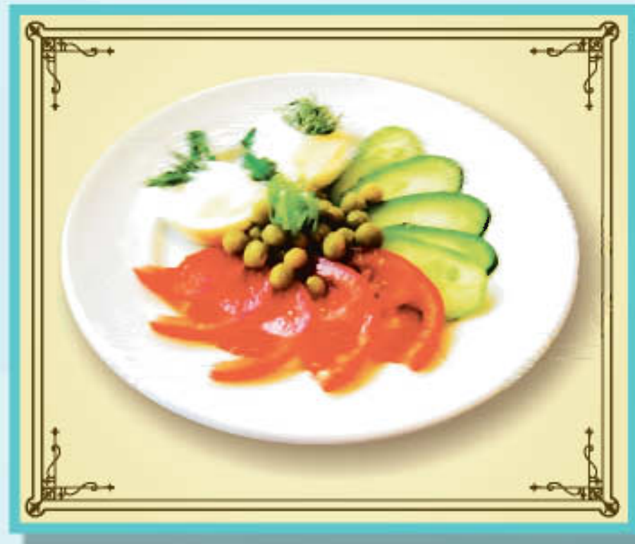
Яйцо под майонезом