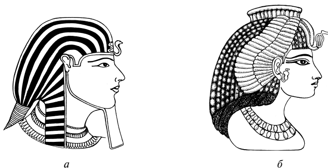
Рис. 1.2. Прически Древнего Египта: а — мужская прическа; б — женская прическа

Дети, юноши и девушки сбрасывали волосы, оставляя одну или несколько прядей на левом виске, которые завивали в локон или заплетали в плоскую косу. Концы волос перехватывали заколкой или цветной тесемкой.