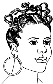
Рис. 1.1. Африканская прическа

Женские прически были более разнообразны, хотя и выглядели значительно проще мужских. Иногда женщины полностью сбривали или выщипывали волосы на голове или оставляли островки в виде борозд, круга; заплетали многочисленные тонкие косички (рис. 1.1). Женщины племени рендили сооружали прическу наподобие петушиного гребня огромного размера — от затылка до лба. Только после того как их сыновья достигали зрелости, прическу можно было изменить на более простую.