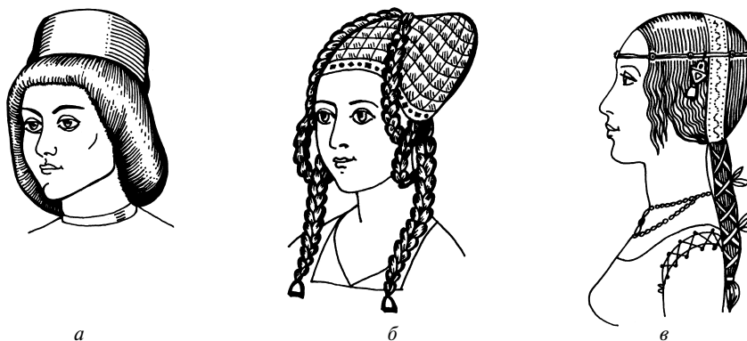
Рис. 1.6. Прически эпохи Возрождения:

а — прическа «колба»; б, в — разновидности прически «флорентийская коса»