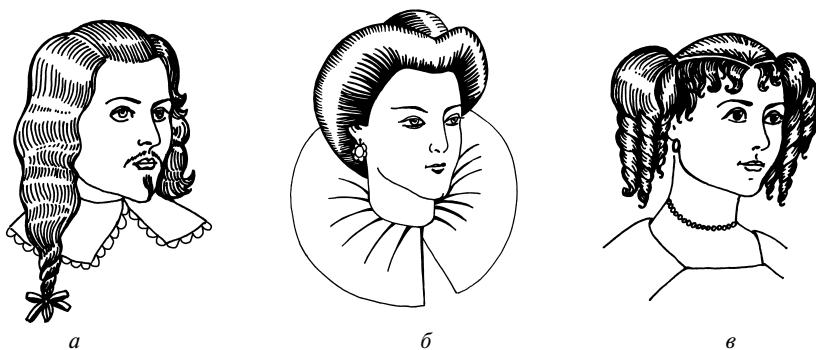
Рис. 1.7. Прически Франции XVI в.:

В середине XVI в. стали широко применять парики разного цвета. Прическа с мелко завитыми локонами, «под болонку», вышла из моды — ее сменили прически с объемными валиками над висками (рис. 1.7, в).