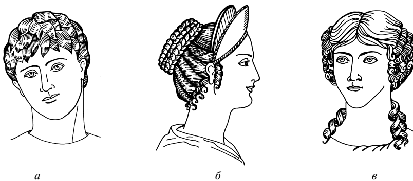
Рис. 1.4. Прически Древнего Рима:

a — мужская прическа (короткая стрижка молодого римлянина); б, в — женские прически: с плетениями из кос и с завивкой волнами