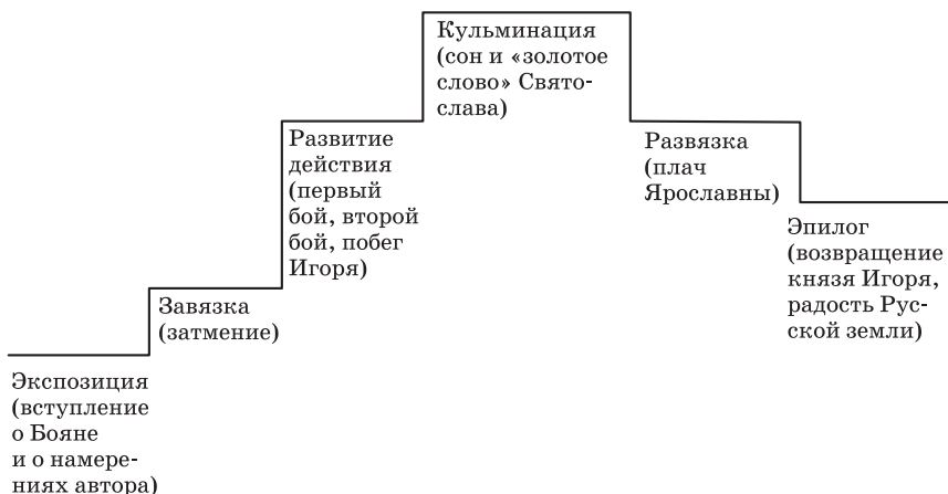
Рис. 1. Композиция «Слова о полку Игореве»

собственную эмоциональную оценку событий, выразить тревогу о Русской земле? 1 (См. Практикум. «Слово о полку Игореве», задание 6).