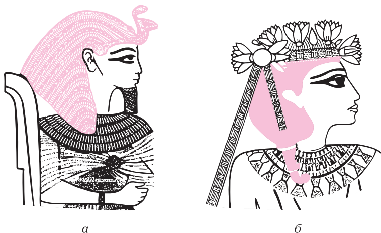
Рис. 1.2. Прически Древнего Египта: а — прическа фараона; б — прическа царицы

Форма, размеры и материал париков указывали на социальное положение владельца (рис. 1.2). Парики были не только сословной принадлежностью, но и выполняли роль головных уборов, защищая от палящих солнечных лучей. Часто во избежание солнечного удара знатные вельможи надевали несколько париков один на другой, создавая тем самым воздушную прослойку. В торжественных случаях использовали длинные парики, завитые крупными