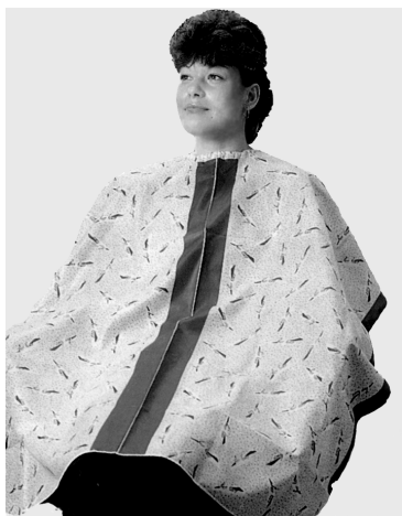
Рис. 6. Синтетический пеньюар

Под синтетический и клеенчатый пеньюар обязательно прокладывают бумажный воротник или хлопчатобумажную салфетку, так как они используются в течение всей рабочей смены (рис. 6).