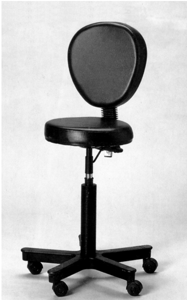
Рис. 4. Передвижное кресло для мастера