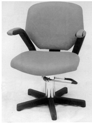
Рис. 3. Парикмахерское кресло