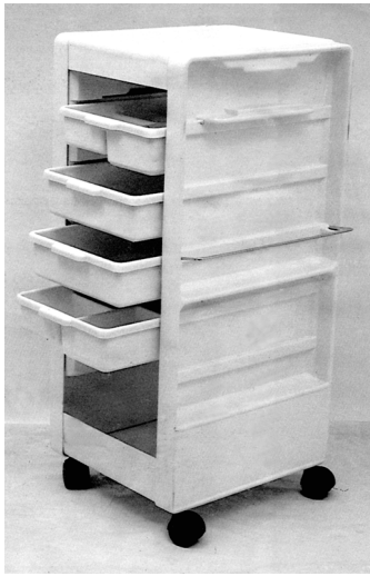
Рис. 2. Туалетный столик (передвижная тележка)