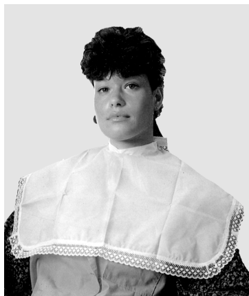
Рис. 7. Пелерина для волос

Салфетки хлопчатобумажные размером 75×40 см используются при бритье лица и головы, стрижке волос, мытье, при фиксации химической завивки.