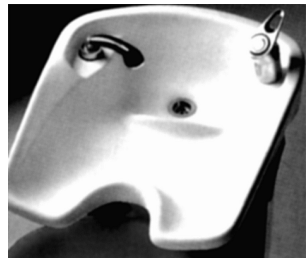
Рис. 5. Раковина для мытья волос мастера