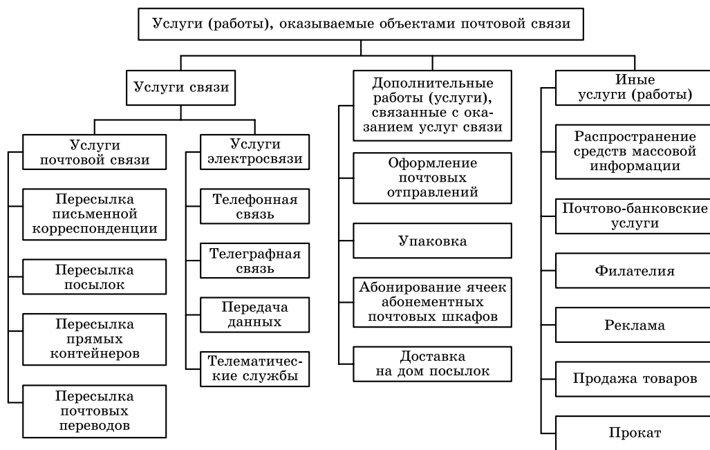
Рис. 2.1. Услуги, оказываемые объектами почтовой связи

Служба EMS (Express Mail Service) , созданная почтовыми администрациями в рамках Всемирного почтового союза, относится к услугам экспресс-по-