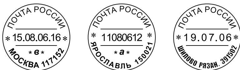
Рис. 2.1. Образцы оттисков календарных штемпелей

Пломбир (рис. 2.3) предназначен для нанесения оттиска с наименованием объекта почтовой связи на металлических или пластмассовых пломбах. С помощью пломбира печатываются закрытые почтовые вещи и почтовые отправления, а также хранилища ценностей.