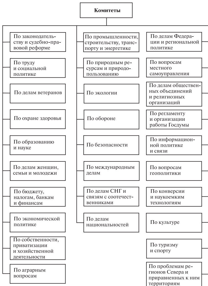
Схема 2. Структура Государственной Думы Федерального Собрания РФ