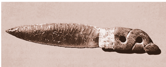
Каменный кинжал. Неолит

К прежним отраслям присваивающего хозяйства — собирательству и охоте — прибавилось рыболовство, ставшее основным источником питания для людей, обитавших по берегам