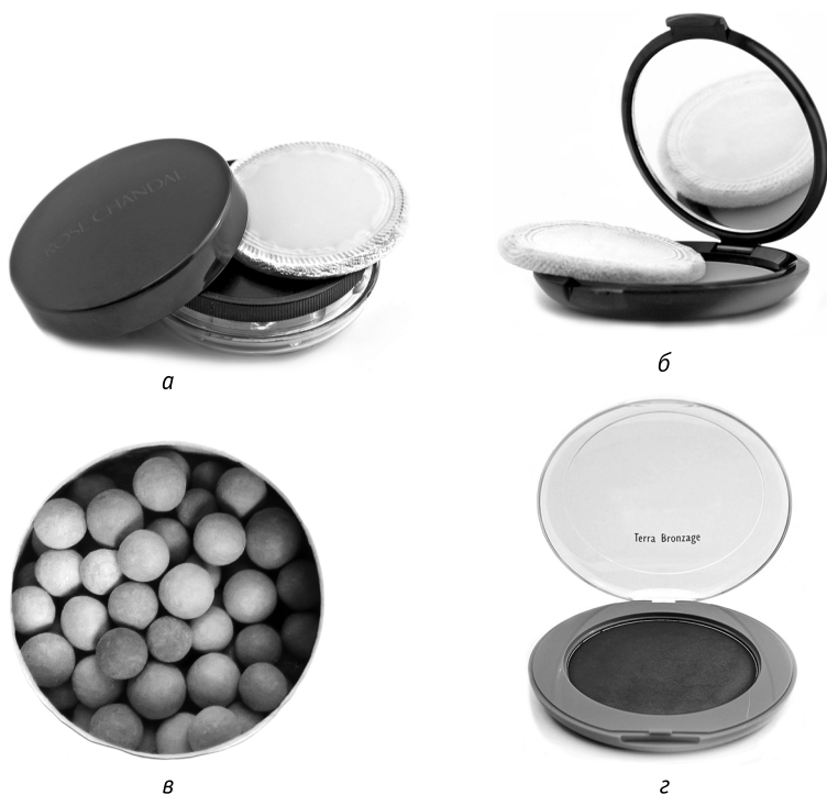
Рис. 2.3. Пудры:

а — рассыпчатая пудра; б — компактная пудра; в — пудра в шариках; г — бронзовая пудра