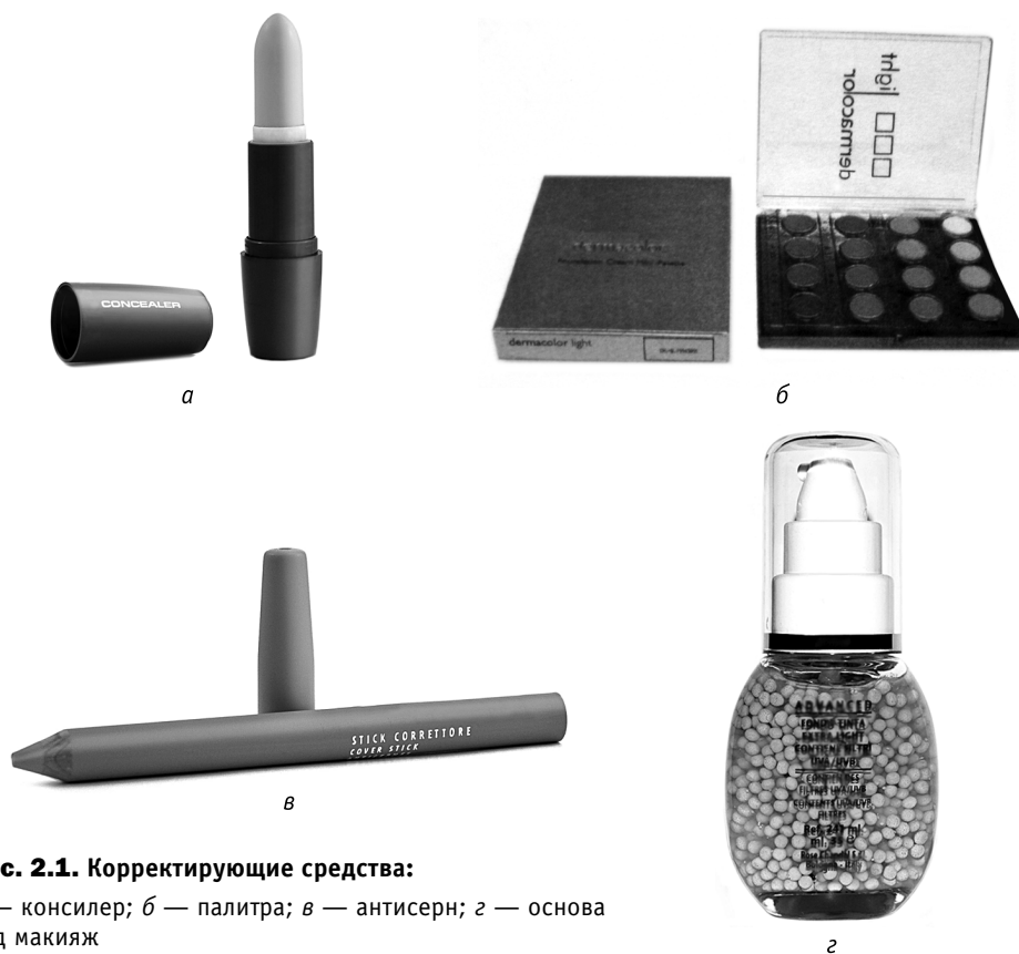
Рис. 2.1. Корректирующие средства:

Корректоры тона , или консилер (англ. conceal — скрывать), не только надежно маскируют недостатки кожи, но и помогают лечить их, осветляют пигментные пятна, подсушивают прыщи, корректируют мимические морщины, выравнивают цвет лица (рис. 2.1, а). Чем более явно выражена пробле-